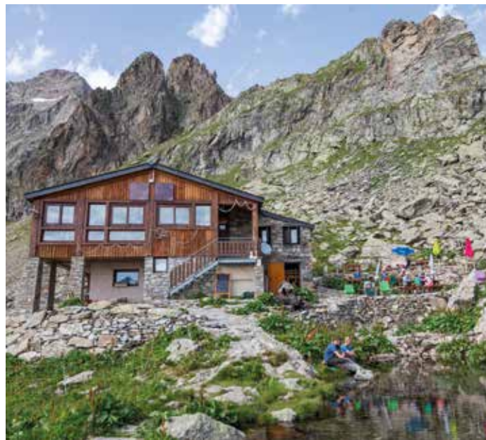
Refuge du Pigeonnier

Dès lors que vous faites appel à notre assistance, les décisions relatives à la nature, à l'opportunité et à l'organisation des mesures à prendre appartiennent exclusivement à notre service assistance.